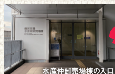
水産仲卸売場棟の入口