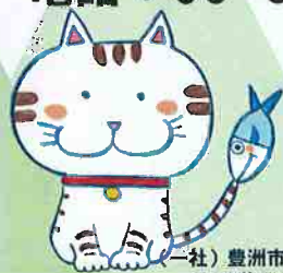
（社）豊洲市場協会 いちばにゃん