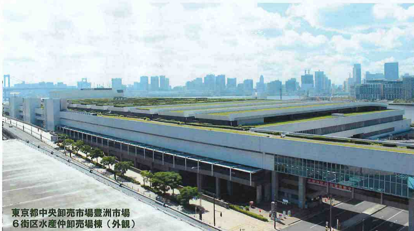
東京都中央卸売市場豊洲市場 6街区水産仲卸売場棟（外観）