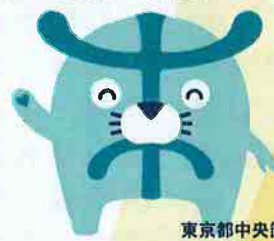
東京都中央卸売市場 イツチーノ